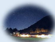
リーゼンヒュッテ